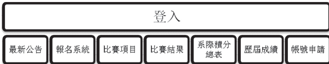
圖 5 前台使用者功能圖

一般使用者輸入網址後，可以點選的功能有最新公告、報名系統、比賽項目、比賽結果、系際積分總表、歷屆成績及帳號申請，如圖 5。