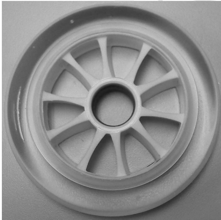
圖 1 本研究製備的直排輪輪子